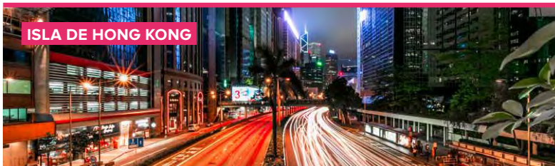
ISLA DE HONG KONG

otras permanecen con un estilo de vida totalmente tradicional. Las más conocidas son Cheung Chau, con buenas playas y un importante festival el “Bun Festival”; Lamma con playas ideales para la pesca, la natación y las barbacoas; y por último Lantau, la más grande de las islas alejadas, que cuenta con una población cercana a los 45 mil habitantes.